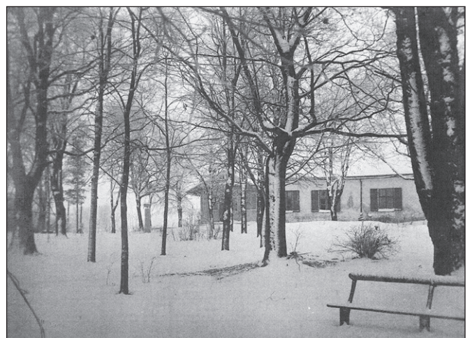
Nõo pastoraat talvel