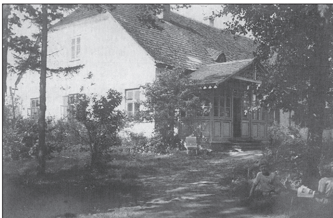
Nõo pastoraat suvel