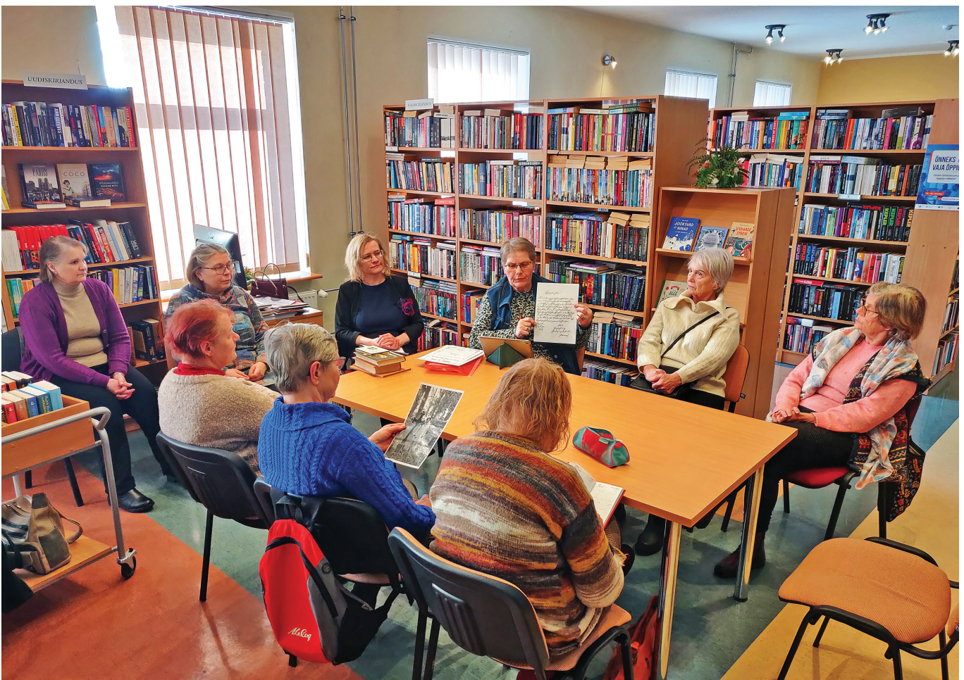
Nõo kihelkonna XVII kulturihommikust osavõtjad Nõo raamatukogus.

♦ 4. jaanuari peajumalateenistusel mälestati teiste hulgas meie koguduse pikaagest õpetajat Harald Tammurit (1917–2001), kelle