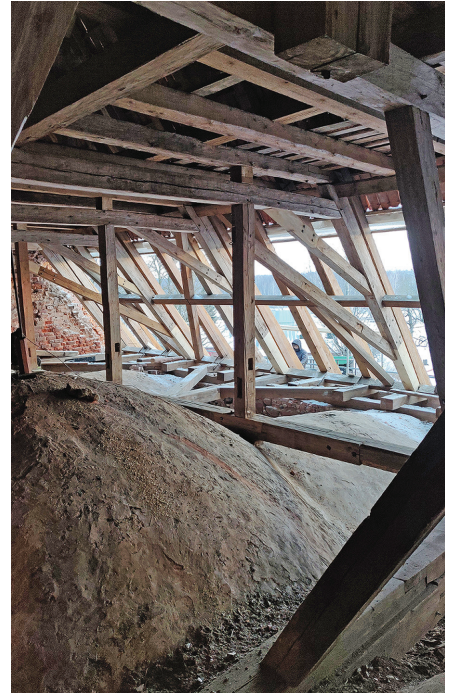
Haruldane vaade meie kiriku pööningult 11.02.26: viimati oli katus niimoodi lahti 35 aastat tagasi.