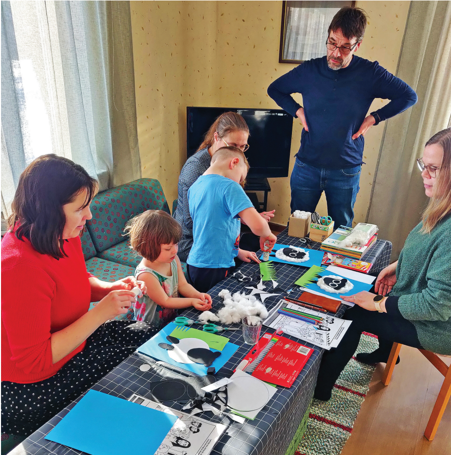
Pühapäevakoolitunnis 14.02.26 Nõo päevakeskuses.