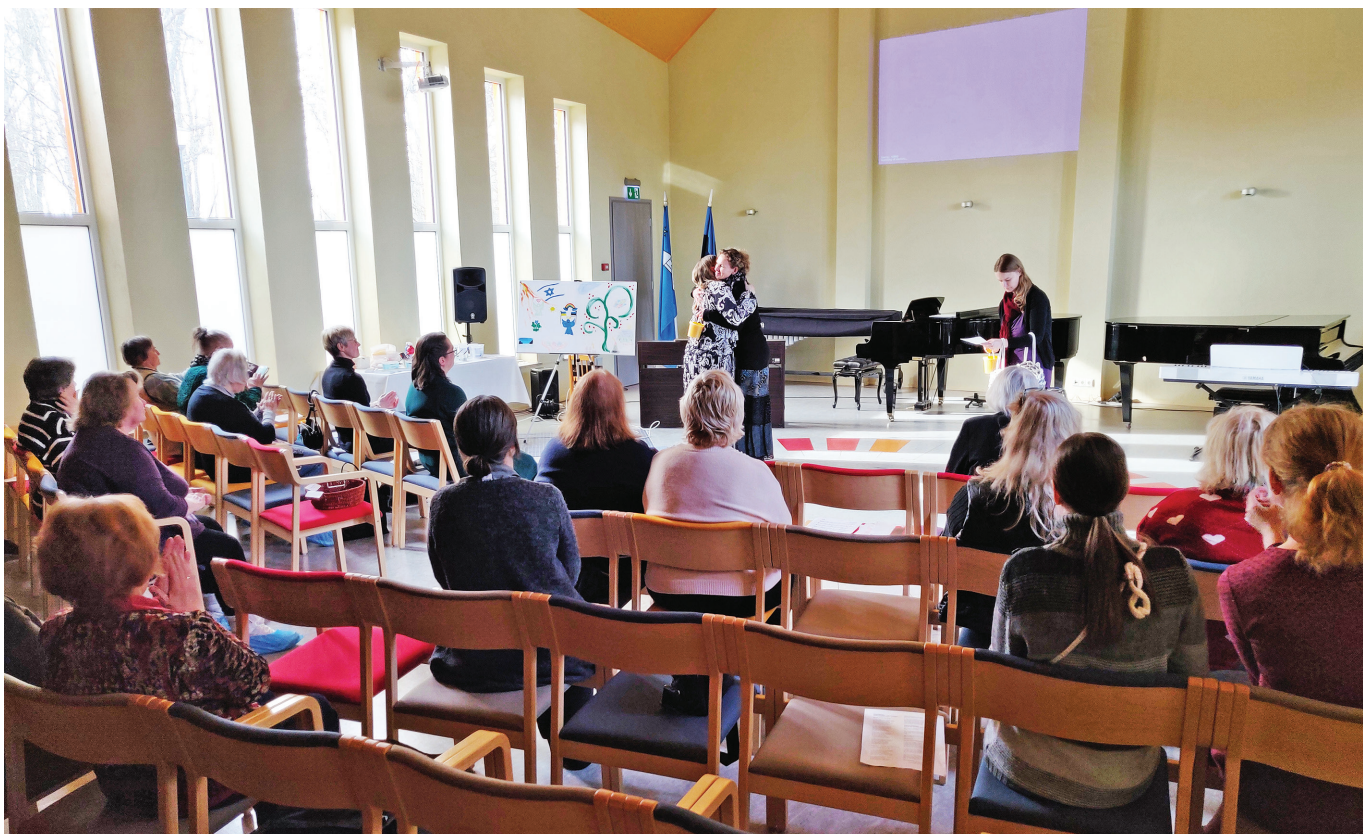
Oikumeenilisel naiste palvepäeval 07.03.26 Nõo muusikakoolis.