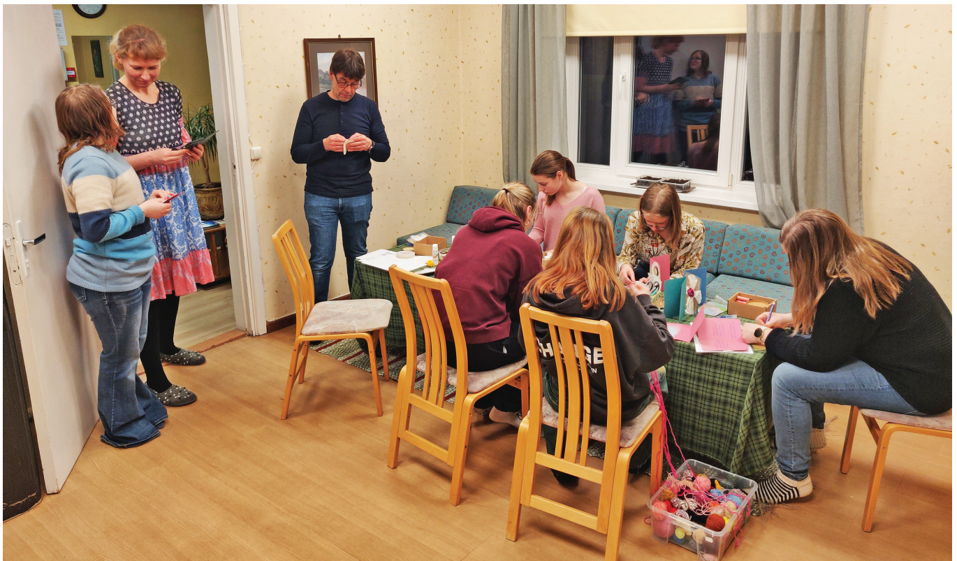
Noorteõhtul 06.03.26 Nõo päevakeskuses.