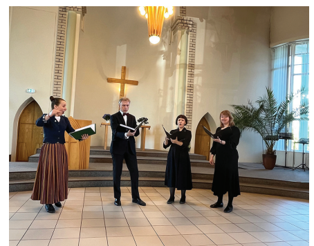
EELK Otepää koguduse ansambel 20.05.23 Tartu Salemi kirikus.