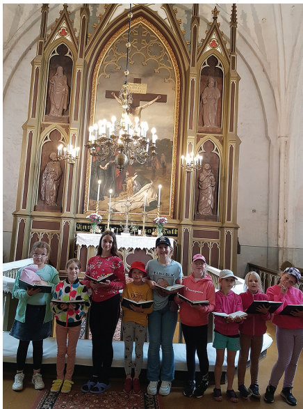
Nõo Põhikooli õpilased meie kirikus 25.05.23.