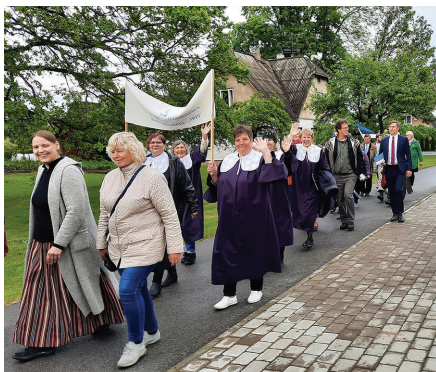
Lustlik lipu- ja laulupäeva rongkäik 04.06.23 Nõos.