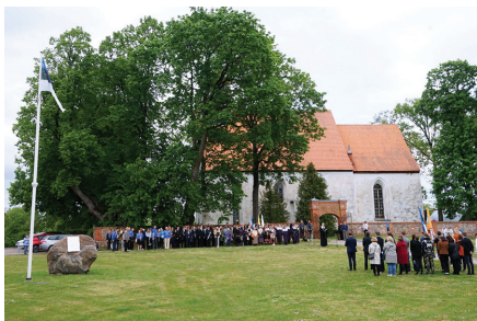
Eesti lipu 139. sünnipäeval 04.06.23 Nõo kiriku esisel lipuplatsil.