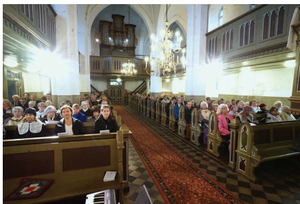
EELK Valga praostkonna laulupäevast osavõtjad 04.06.23 meie kirikus.