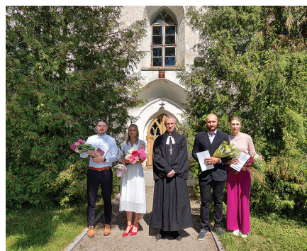
Leerilapsed koos õpetajaga leeripühal 11.06.23 Nõo kiriku ees.