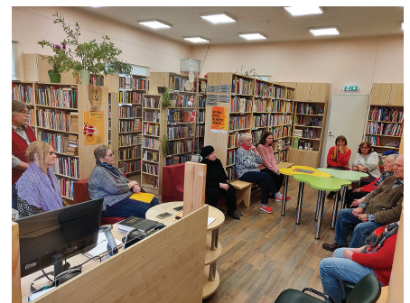
Nõo kihelkonna VII kultuurihommik 06.05.23 Luke raamatukogus.