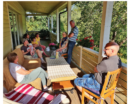
Osadusgrupi hooaja lõpetamine Voika külas 20.06.23.