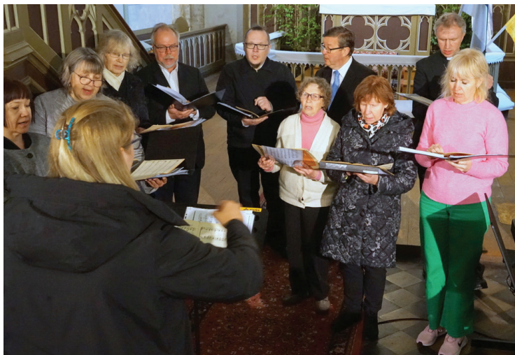
Meie koguduse segakoor EELK Valga praostkonna laulupäeval 04.06.23 meie kirikus lauluga Jumalat kiitmas.

Ps 103:1–5, 14–22: Kiida, mu hing, Issandat, ja kõik, mis mu sees on, tema püha nime! Kiida, mu hing, Issandat, ja ära unusta ainsatki tema heategu! Tema annab andeks kõik su ülekohtu, tema parandab kõik su tõved. Tema lunastab su elu hukatusest ja ehib sind helduse ja halastusega nagu pärjaga. Tema täidab su suu heaga, et su iga saab uueks nagu kotkal. ... Sest ta teab, millist tegu me oleme; tal on meeles, et oleme põrm. Inimese elupäevad on nagu rohi: ta õitseb nõnda nagu õieke väljal; kui tuul temast üle käib, ei ole teda ja tema ase ei tunne teda enam. Aga Issanda heldus on igavesest igavesti nendele, kes teda kardavad, ja tema õigus jääb laste lastele, neile, kes peavad tema lepingut ja mõtlevad tema korraldustele, et teha nende järgi. Issand on oma aujärje kinnitanud taevasse, tema kuningriik valitseb kõiki. Kiitke Issandat, tema inglid, teie, vägevad sangarid, kes täidate tema käske, kuuldes tema sõna häält! Kiitke Issandat, kõik tema väehulgad, tema teenijad, kes teete tema tahtmist! Kiitke Issandat, kõik tema tööd kõigis tema valitsuse paigus! Kiida, mu hing, Issandat!