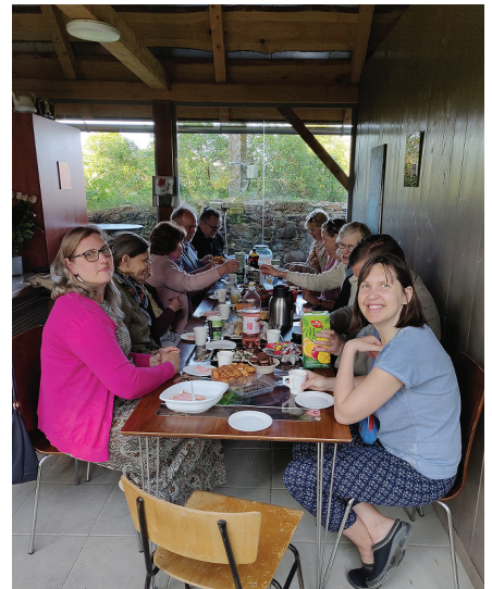
EELK Nõo koguduse segakoori lõpupidu 12.06.23 kirikuaia suvekohvikus.