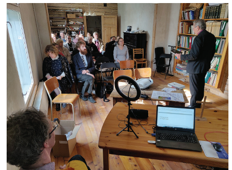
EELK Valga praostkonna sinod 10.05.23 Elva pastoraadis.