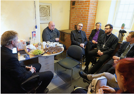
EELK Valga praostkonna vaimulikud ja külalised meie väikses aga mugavas käärkambris.

piiblitund. Jaanuari-veebruari jooksul kogunesid piiblingid ka teistes meie kuulutuspunktides — Meeri seltsimajas, Nõo hooldekodus ja Nõgiaru raamatukodus.