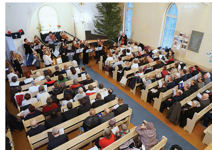
„Jõulurõõmu ootuses“ Elva kirikus.

♦ 6. jaanuaril tähistati kirikus kolme-kingapäeva jumalateenistusega jõulu-