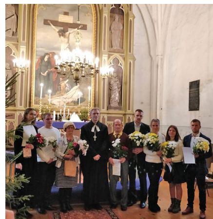
Leerilapsed koos õpetajaga pärast jumalateenistust altari ees.