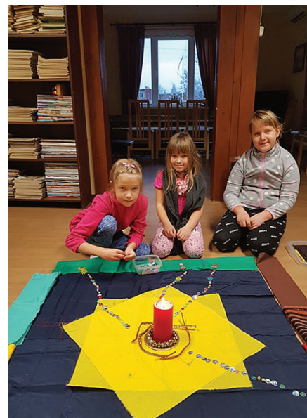
5. jaanuari pühapäevakoolilapsed on pildile püütud!

aja lõppu. Teenis õp Mart Jaanson, orelit mängis koguduse organist Katre Kruuse.