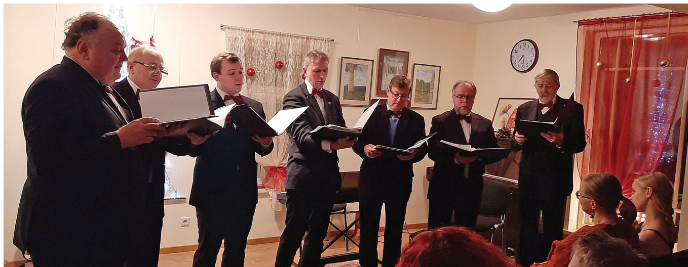
Nõo kiriku meesansambel 2019. aasta täiskoosseisus Meeri seltsimaja advendikontserdil.