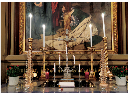
Rein Soidla valmistatud erilised jõulu-kuused 05.12.24 meie kiriku altariil.