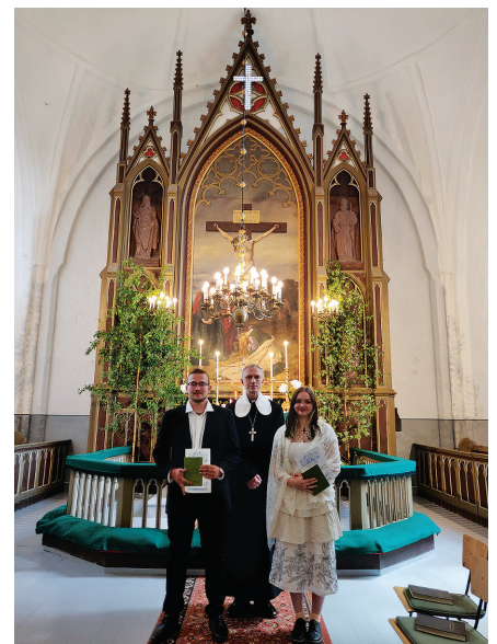
Leerilapsed koos õpetajaga 16.06.24 meie kiriku altari ees.

mad suvevaheajale. Erandina jätkusid igakuised piiblitunnid Nõo hooldekodus ja Taizé-palvused kirikus.