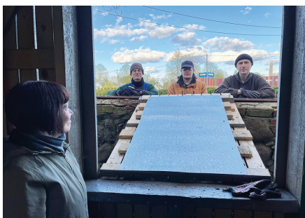
Tublid talgulised 10.05.24 õhtul meie kirikuaia puukuuri taustal.