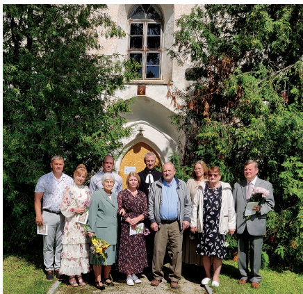
Leeri mälestuspäevalised koos õpetajaga 21.07.24 meie kiriku lõunaukse ees.