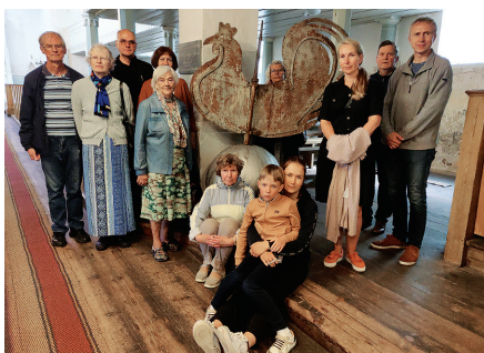
Meie koguduse bussiekskursioonist osavõtjad koos torniku kega 29.07.24 Suure-Jaani kirikus.