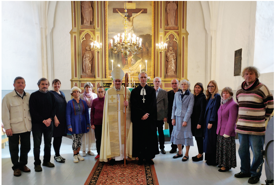
Jumalateenistusest osavõtjad 22.09.24 meie kiriku altari ees. Keskel piiskop Anti Toplaan.