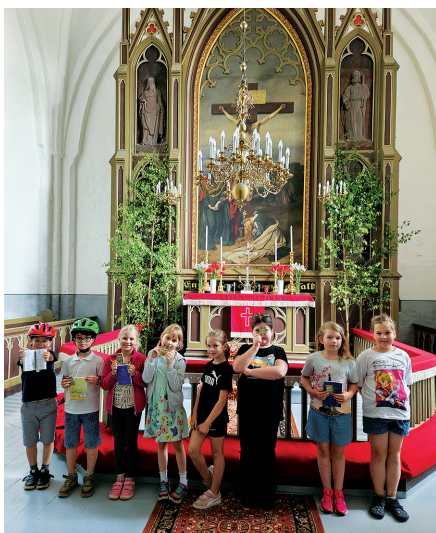
Nõo Põhikooli pärimuskultuuri ringi lapsed 20.05.24 meie kiriku altari ees.