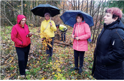
XIII Nõo kihelkonna kultuurihommikul osalejad 26.10.24 endise Tamsa koolimaja ja Pangodi vallamaja asupaigas.