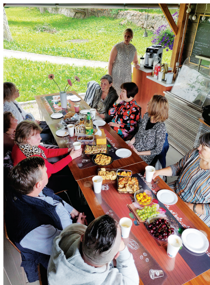
Meie koguduse segakoor 17.06.24 hooaja lõpetamisel kirikuaia suvekohvikus.