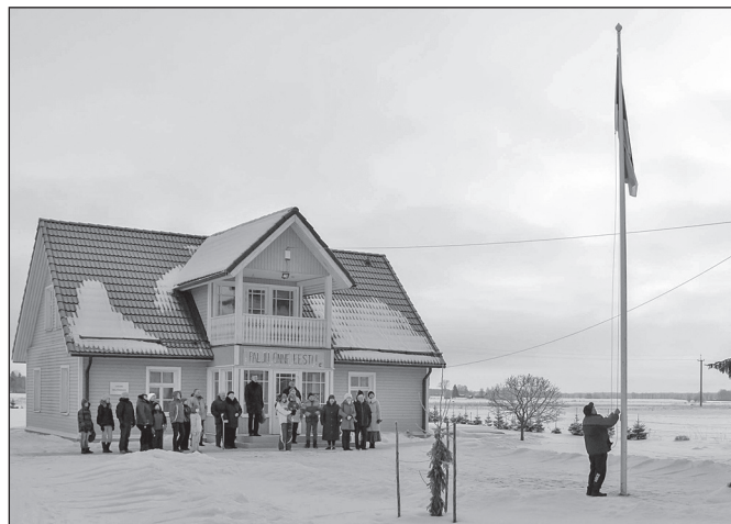
Trikolori heiskamine Meeri seltsimaja juures juubelipäeva päiksetõusul.