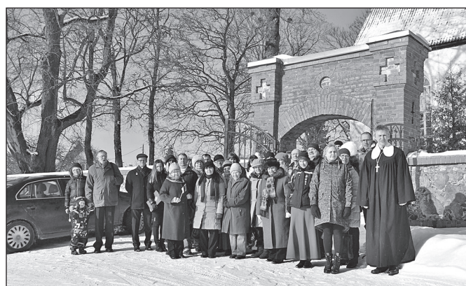
Eesti Vabariigi 100. juubeli jumalateenistusest osavõtjad.