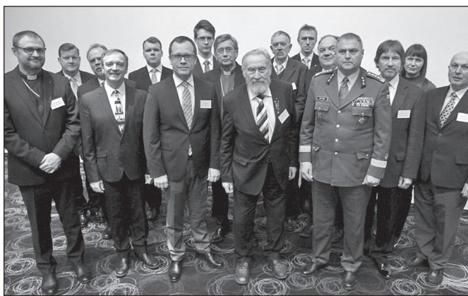
Palvushommikusöögist osavõtjad, korraldajad ja aukülalised.

nud aastaks. Plaanid saidki peetud. Annaks Jumal, et need ka teostuksid!