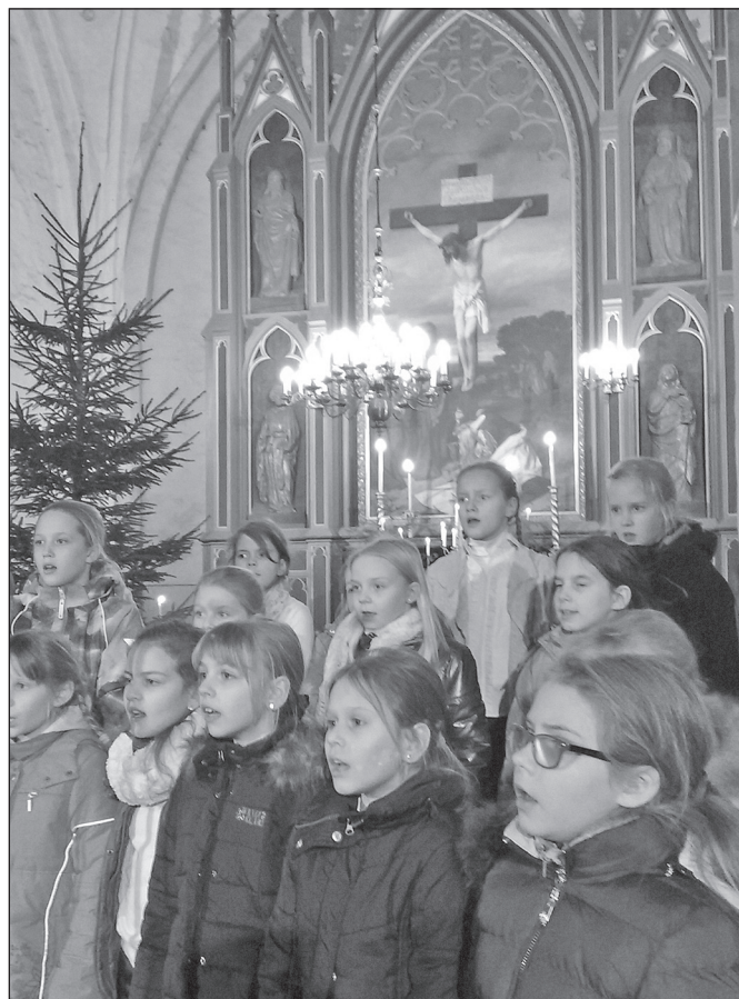
Nõo koolilapsed kirikus esinemas.

◆ 11. detsembri ennelõunal külastasid meie kirikut Luke laste- aia lapsed koos õpetajatega. Külalistele tutvustas kirikut õp Mart Jaanson.