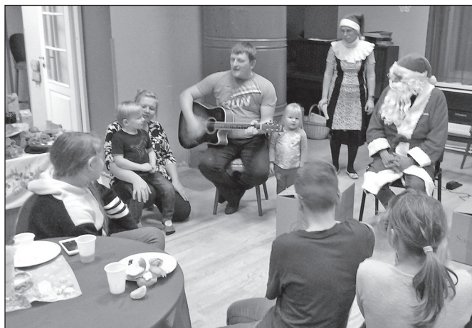
Koguduse jõulupidu Luke külakeskuses.

♦ Pärast 1. jaanuari uusaasta jumalateenistust siirdus Nõo kiriku meesansambel, nagu igal aastal sel päeval, teele ansambli tenori Mati Koonukõrbi maakoju Põlvamaal, et pidada plaane ala-