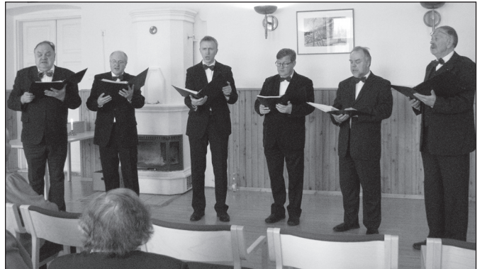
Nõo kiriku meesansambel 04.03.17 Järva-Jaani pastoraadis kontserti andmas.