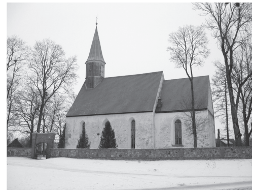
Nõo Püha Laurentsiuse kirik.