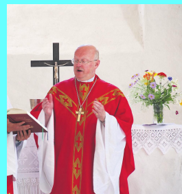
Piiskop Tiit Salumäe