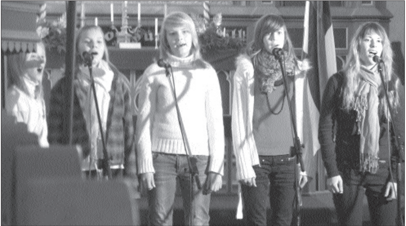
Tallinna erahuvialakooli Meero Muusik 13–15-aastaste tütarlaste ansambel.