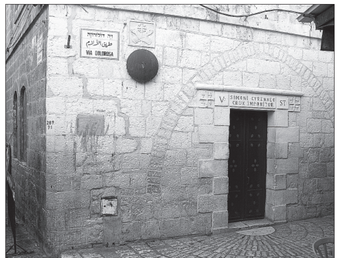
Jeesuse Jeruusalemma ristitee 5. peatus, mis viitab kohale, kus Siimonat Küreenest sunniti kandma Jeesuse risti (Lk 23:26).