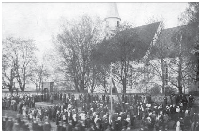
Kaitseliidu Nõo maleva õnnistamine 10. mail 1925.