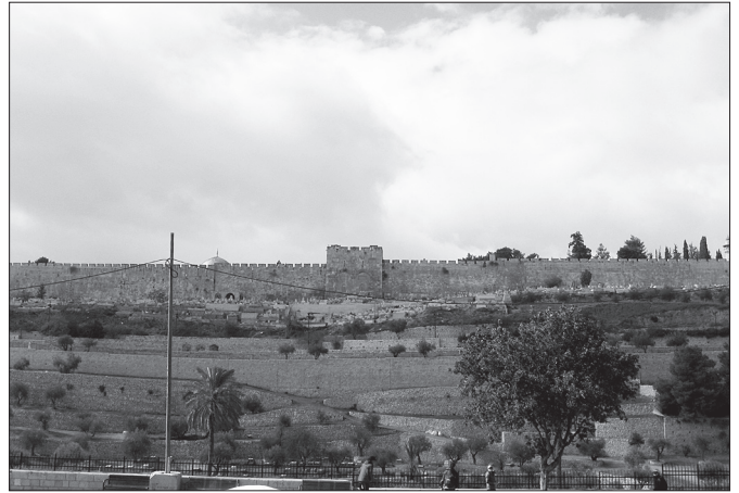
Vaade Rahvaste kiriku trepilt Kuldväravale, millest Jeesus kord kuningana Jeruusalemma sisenes.

Naasesime hotelli ja kell 10.00 jagunesime gruppidesse. Osa meist läks vanalinna ja ortodokssete juutide linnaossa (Mea