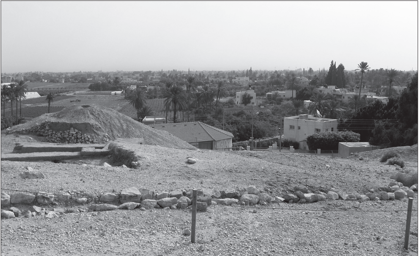
Jeeriko – maailma vanim, kuid hüljatud linn. Taamal viljakas oasis laiuv asula.

“Rahutegijaile külvatakse rahus õiguse vilja.” (Jk 3:18)